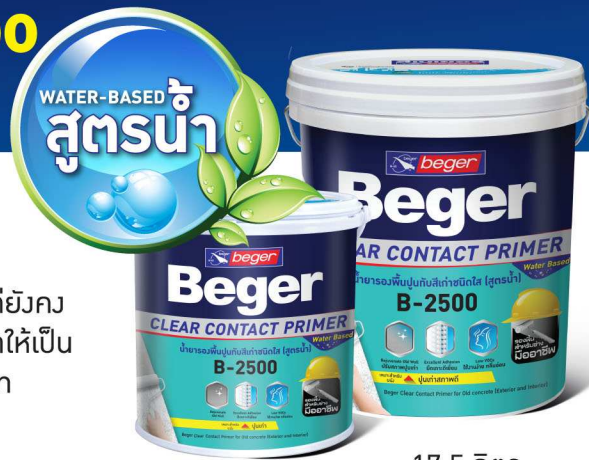
3.5 ลิตร 17.5 ลิตร

น้ำยารองพื้นปูนกับสีเก่าชนิดใส สูตรน้ำ กลิ่นอ่อน ผลิตจากทาร์อะคริลิกแท้ 100% เหมาะสำหรับพื้นผนังปูนฉาบ ผนังคอนกรีต กระเบื้องแผ่นเรียบ ที่เคยทาสีมาแล้วแต่ยังคงสภาพดี เนื้อสีสามารถแทรกซึมผ่านช่วยเสริมการยึดเกาะพื้นผิวปูนเก่าและสีทับหน้าให้เป็นเนื้อเดียว ทนทานต่อน้ำ ต่าง ป้องกันการเกิดเชื้อราและตะไคร่น้ำ ปราศจากสารปรอทและตะกั่ว จึงปลอดภัยต่อผู้ใช้และผู้อยู่อาศัย สามารถใช้ได้ทั้งภายในและภายนอก